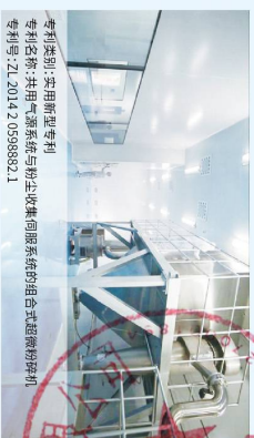
— 专利类别: 采用新型专利 — 专利名称: 共用气流系统与粉尘收集回路的组合式超微粉碎机 — 专利号: ZL2014 2 0598982.1

御芝林药业研发出新型超微粉碎设备,比原来的超微粉碎设备更先进,并获得了国家发明专利。 新型超微气流粉碎系统集离心粉碎、冲击、碰撞、摩擦、剪切、挤压等高速高压、气流喷射旋转高新物理技术为一体,粉碎中草药物料细度更高,除尘除杂质效果更好。经过这项专利技术,物料细度更更细胞,吸收快、吸附性好、溶解性高、生物活性强,做到微量高效。